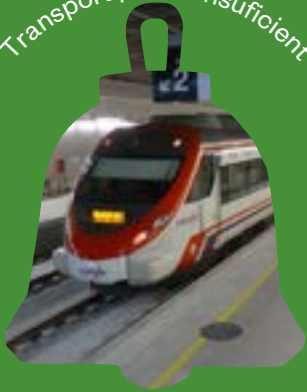
Transport públic insuficient