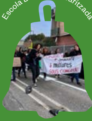
Escola Bressol precaritzada