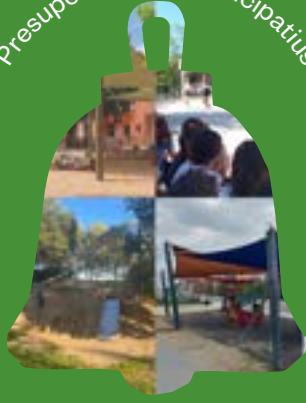
Presupostos poc participatius