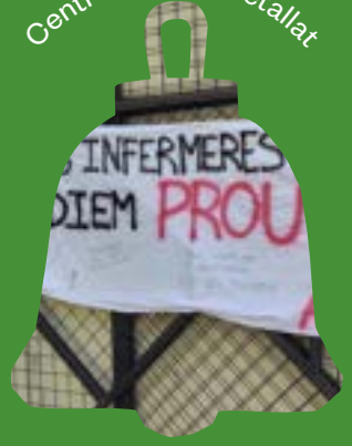
Centre de Salut retallat