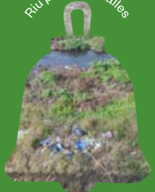
Riu ple de deixalles