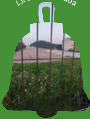
La Llosa tancada